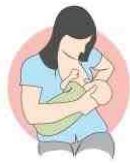
روش گهواره ای برعکس