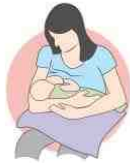
روش گهواره ای

با مشکلات زیادی مثل لچ ضعیف، شیر کم، تقاضای بیش از حد و عفونت های سینه مواجه شوند. اگر یک نوزاد خواب آلود دارید که به هنگام مکیدن خسته می شود، فقط پاهای کودک را در طول مواقع شیردهی برای بیدار نگه داشتن آن ها غلغلک دهید، این کار باعث می شود مطمئن شوید که آن ها با شکم خالی به خواب نمیروند .