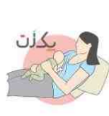
شیردهی به حالت خوابیده به پشت