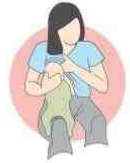
روش کمک آغوشی