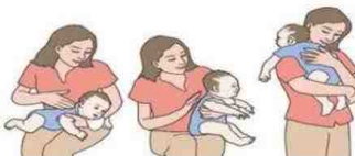
نحوه آروغ گیری نوزاد

در وضعیت اورژانسی اگر احساس کردید که کودک در حال خفگی است، می توانید او را در همان حالتی که برای آروغ زدن استفاده کرده اید، قرار دهید. روش درست برای پاسخ دادن به این، ابتدا با استفاده از تنها ۲ انگشت، با فشار روی قلب انجام می شود و سپس، ضربه را تا زمانی که کودک شروع به سرفه کند انجام دهید و به یاد داشته باشید که کودک کوچک است و نباید محکم فشار یا ضربه بزنید، سرفه نشانگر این است که شی خارجی از مسیر هوا تغییر کرده است.