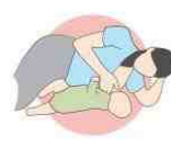
روش خوابیده به پهلوی