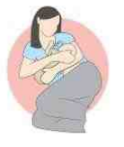
روش خوابیده به پهلوی گهواره ای