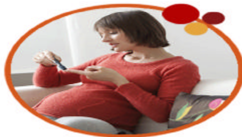
دیابت در بارداری