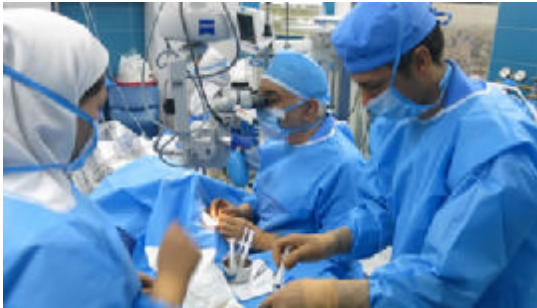
واحد آموزش سلامت